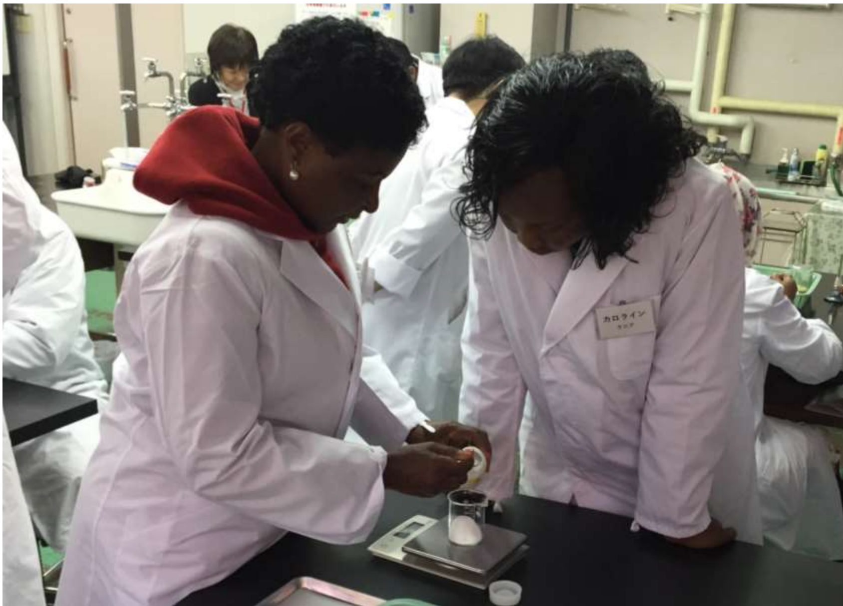
帯広市児童会館で、物の溶け方についての実習を行いました。