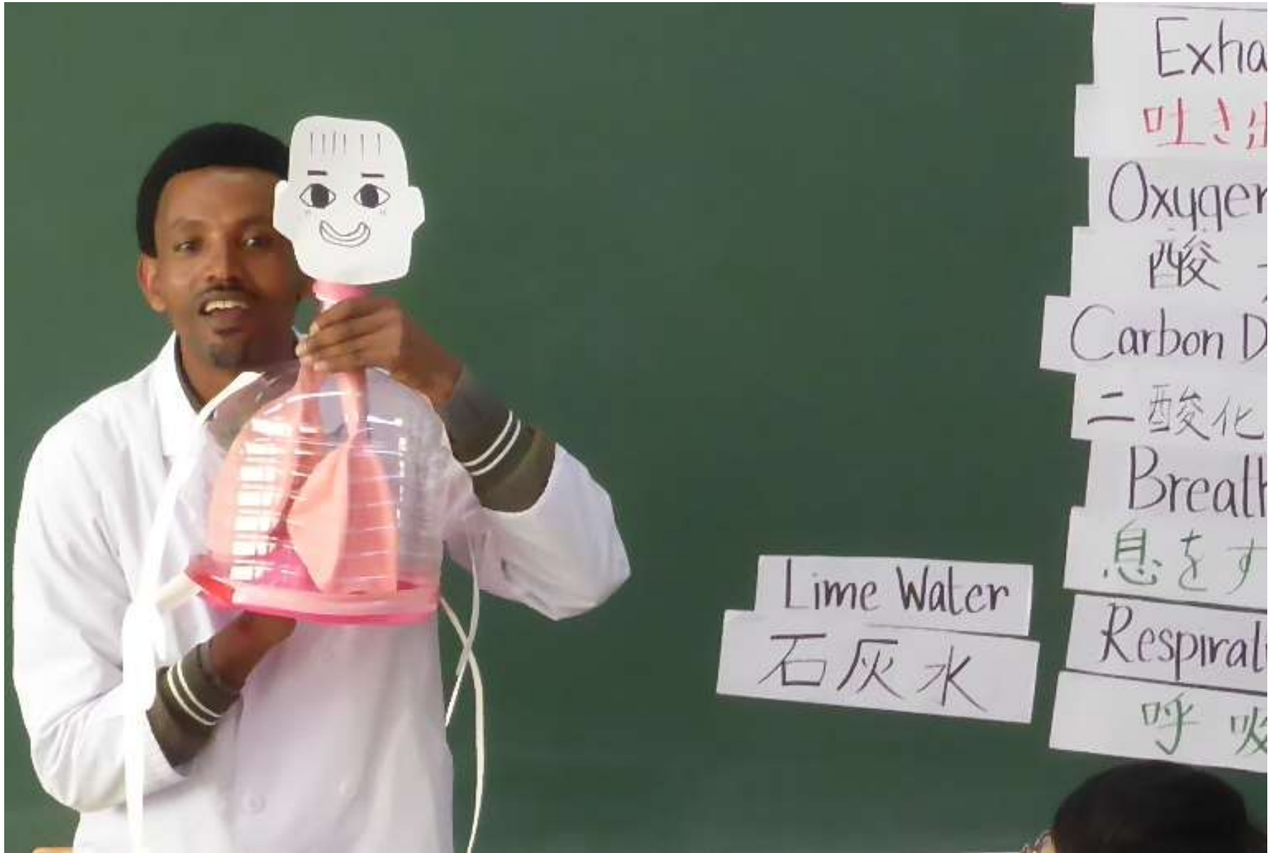
ペットボトルと風船で作成した肺と横隔膜のモデルを使用し、帯広柏葉高校で呼吸についての授業を行いました。