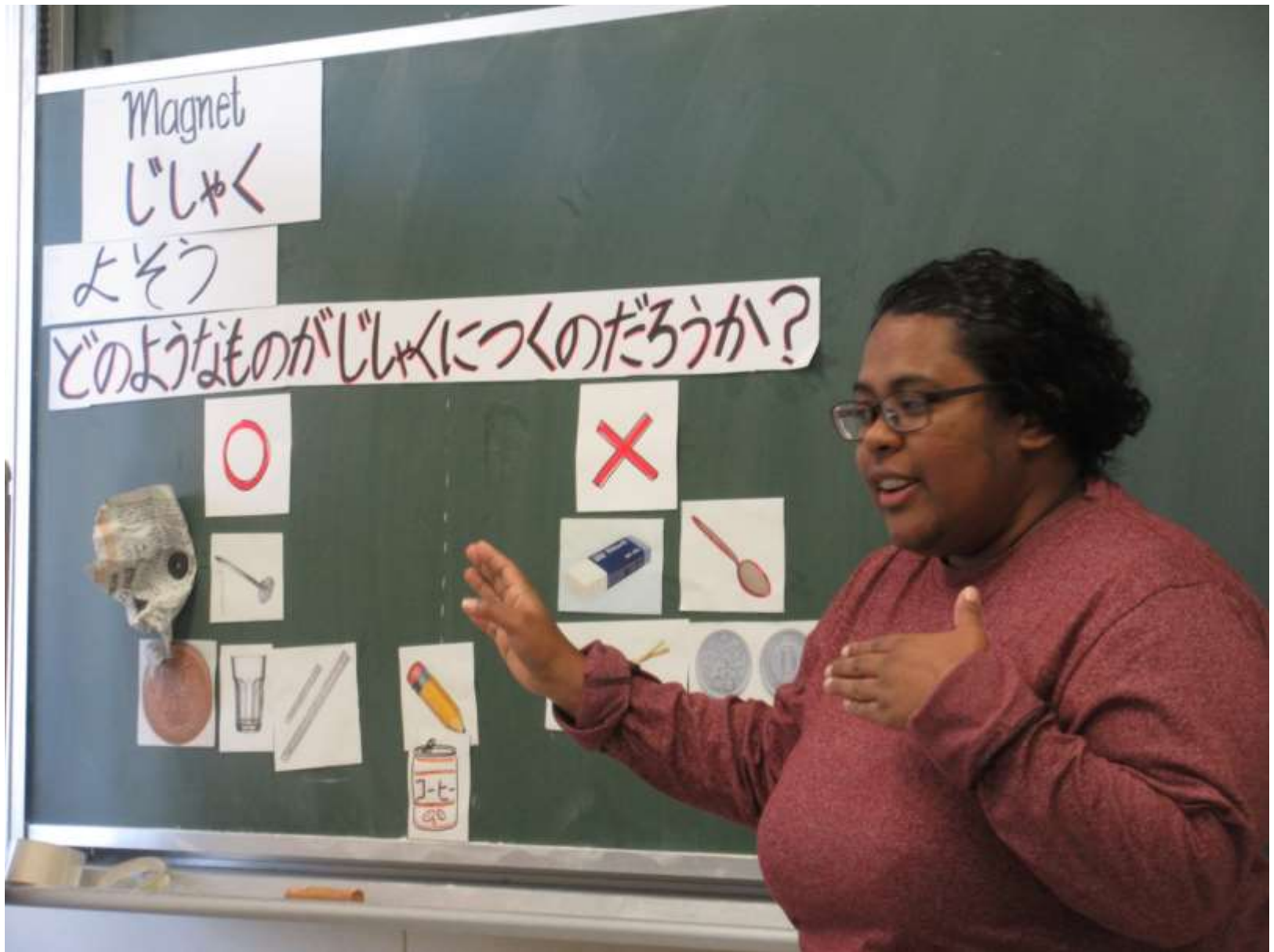
北海道教育大学附属釧路小学校で「磁石の性質」についての授業を行いました。